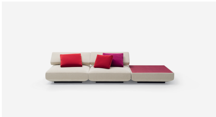
B25D + B25SCS