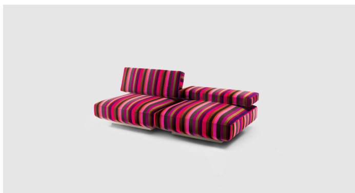
B25N + n° 2 B25SCA + B25SCD