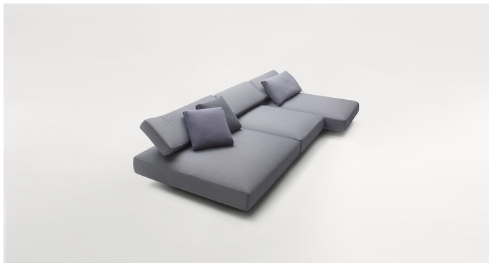
B25D + B25SCS + n° 3 B25SCA+ B25L + B25N + n° 2 B25SCA + B25SCD